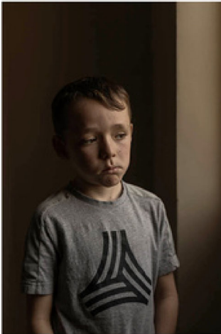
Erster Preis UNICEF Foto des Jahres 2024